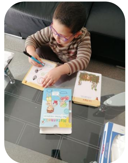
On apprend à la maison comme à l'école

« Les parents et leurs enfants sont venus à l'école maternelle de Torigné et des livres leur ont été prêtés... cela crée du lien avec les familles et permet d'enrichir la continuité pédagogique autour du livre »