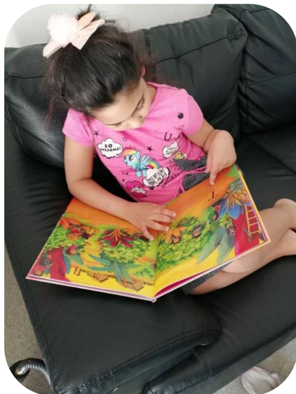
Une jeune lectrice à Charleville Mézières

Cette belle action démontre qu'avec la volonté, l'engagement, les compétences, l'efficacité et l'enthousiasme de tous les maillons de cette longue chaîne de solidarité, on peut apporter rapidement, à des milliers d'enfants défavorisés et à leurs familles, une aide pour la continuité éducative et une attention qu'ils n'imaginaient pas recevoir.