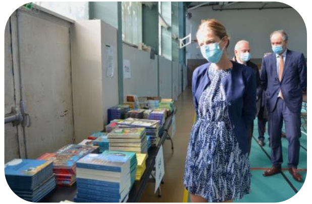
Charline Avenel, rectrice de l'académie de Versailles, lors de la distribution des livres