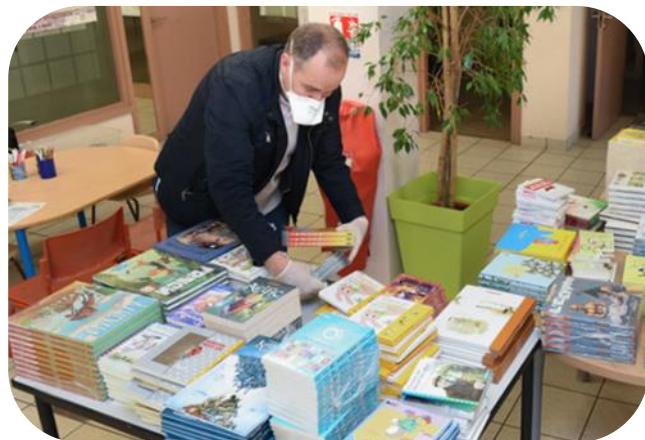
Les opérations de tri à la mairie d'Orléans