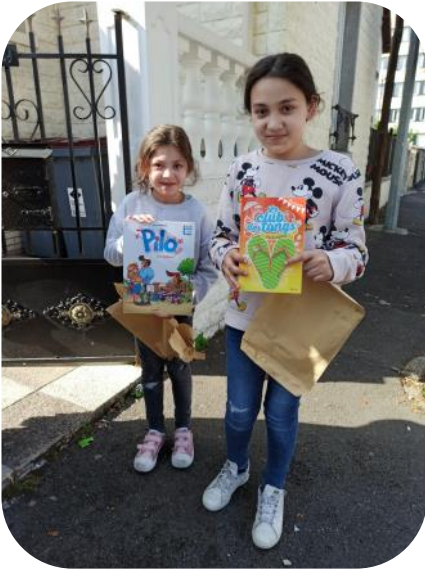
Des petites filles de Bondy heureuses de leurs nouvelles lectures