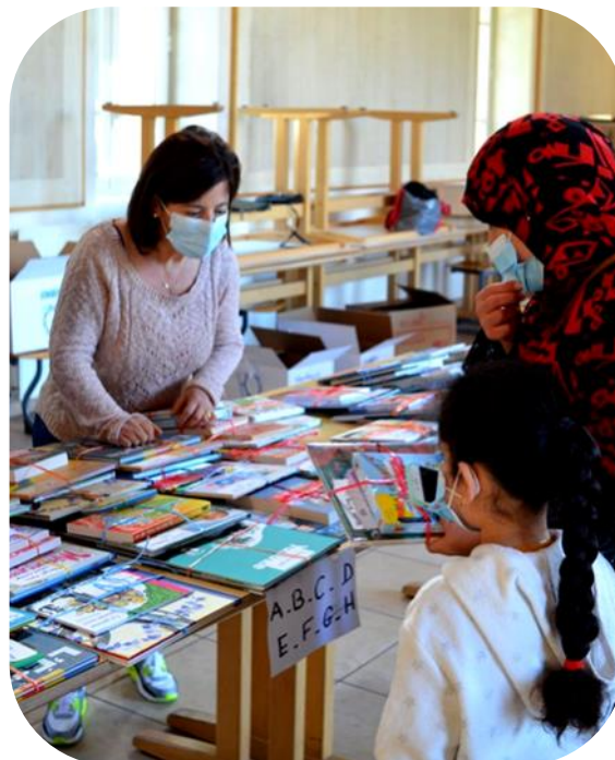
Une remise de livres dans le respect des règles sanitaires dans la ville de Grigny

Nous tenons à remercier tout spécialement notre partenaire logistique, la société Microlynx basée à Rennes, qui, malgré des effectifs réduits en ces circonstances, s'est mobilisée pour préparer rapidement et efficacement les lots de livres destinés aux Cités éducatives.