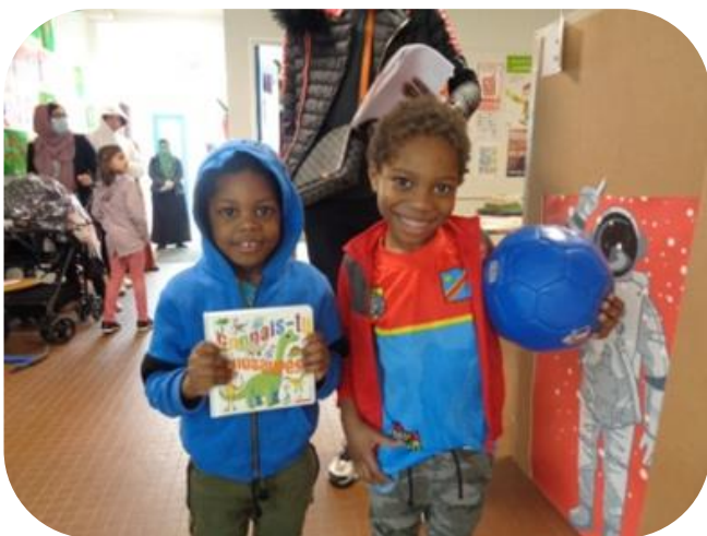
Des sourires qui réchauffent le cœur

« Des parents heureux parce que les attentes des enfants étaient grandes d'avoir de nouveaux livres. Merci BiblioneF. »