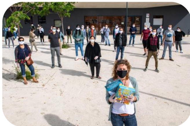
Les volontaires ayant participé à la distribution des livres à La Seyne sur Mer