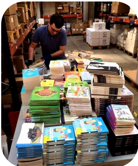
Les opérations de préparation des lots au sein de la plateforme logistique de Biblionef