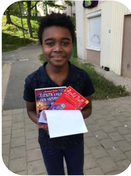
Un jeune enfant de la Cité éducative de la Ronde Couture à Charleville Mézières