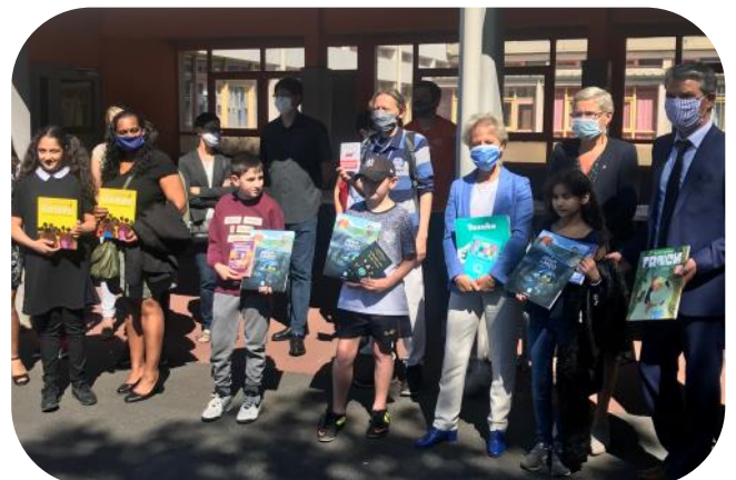
La remise de livres organisée par la mairie d'Hérouville Saint Clair