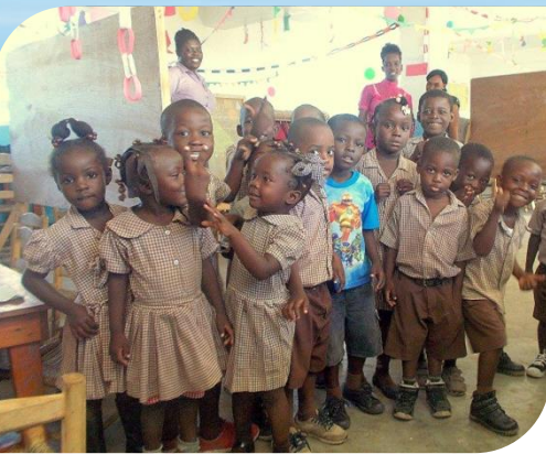
Les écoliers d'Île à Vache

Dans ce pays qui est l'un des plus pauvres au monde, la Good Samaritan Foundation s'efforce, depuis 1992, de donner à une jeunesse très déshéritée les bases d'une éducation et la possibilité d'un avenir meilleur.