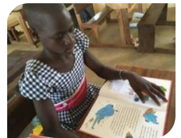
Remise des livres Biblionef à l'école de Kouroukorosso

Conçues dans des matériaux légers facilitant leur déplacement, ces bibliothèques circuleront entre les écoles afin d'offrir aux élèves et aux professeurs un large éventail de références. Dans chaque établissement, des « caravanes » formeront le corps éducatif à l'enseignement de la lecture et sensibiliseront les communautés à l'importance du livre, dans un esprit positif et de manière amusante, grâce à des concours et des remises de prix.