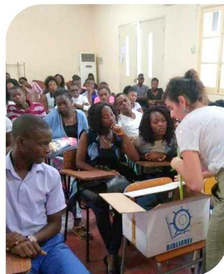
Remise des livres Biblionef à l'école de formation des professeurs Garcia Neto, à Luanda

De beaux livres neufs et utiles afin d'aider les uns à parfaire leur niveau de langue et encourager les autres à poursuivre leurs efforts !